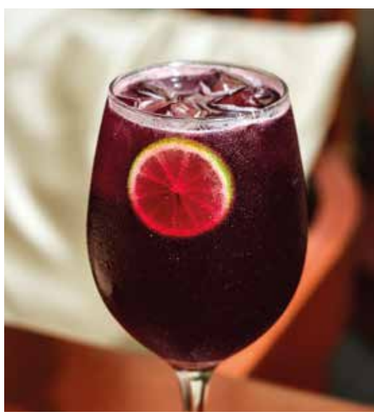
TINTO DE VERANO