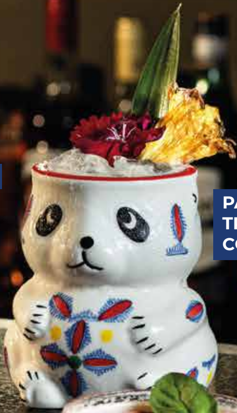
PANDA TROPICAL COFFEE