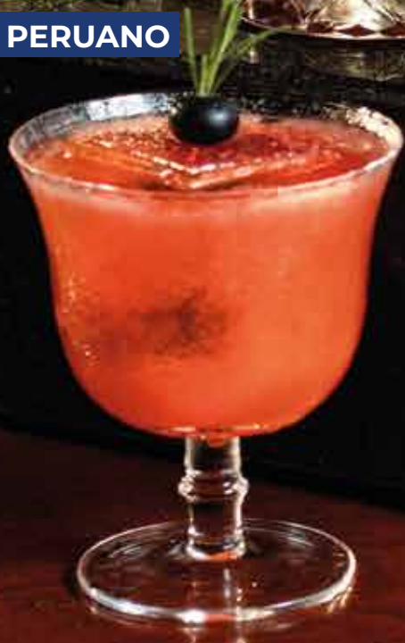
PODEROSA Y DECIDIDA