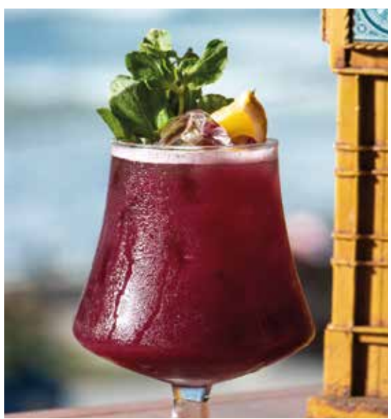
TINTO DE VERANO